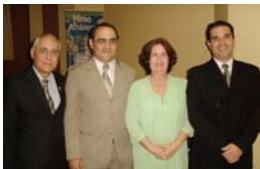
Iel, Senac e Prefeitura de Rio Verde: atuação conjunta na inclusão digital

Na iniciativa, que agrega valor ao Programa de Estágio do IEL, os três parceiros proporcionam aos estudantes suprir carência nas áreas de informática e língua portuguesa, que dificulta o aproveitamento dos estudantes de nível médio, técnico e superior pelas empresas do município. O objetivo da Ação de Inclusão Digital ao treinar os jovens é deixá-los mais