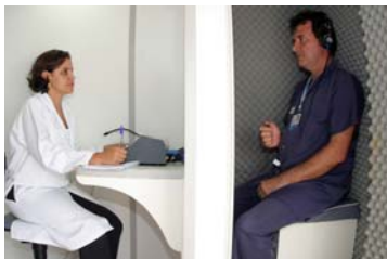
Médica do trabalho realiza exame audiométrico: prevenção

A Delegacia Regional do Trabalho (DRT) é o órgão responsável por fiscalizar a aplicação das exigências legais e tem também o poder de autuar e embargar, se as normas não estiverem sendo devidamente cumpridas. "O Sistema