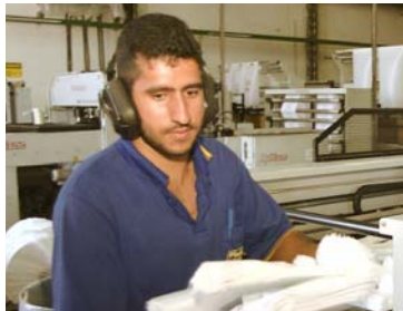
Trabalhador da JBM Embalagens utiliza equipamentos de proteção individual para prevenir doenças ocupacionais

Sesi Goiânia (Centro) Telefone: 3216-0400